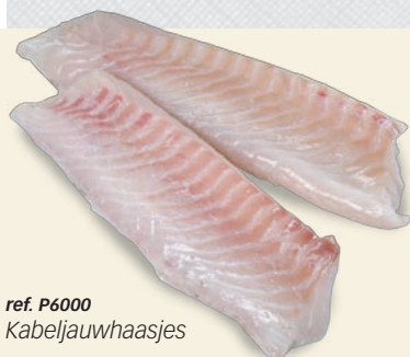
ref. P6000 Kabeljauwhaasjes