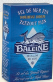
ref. O251 Zeezout, fijn